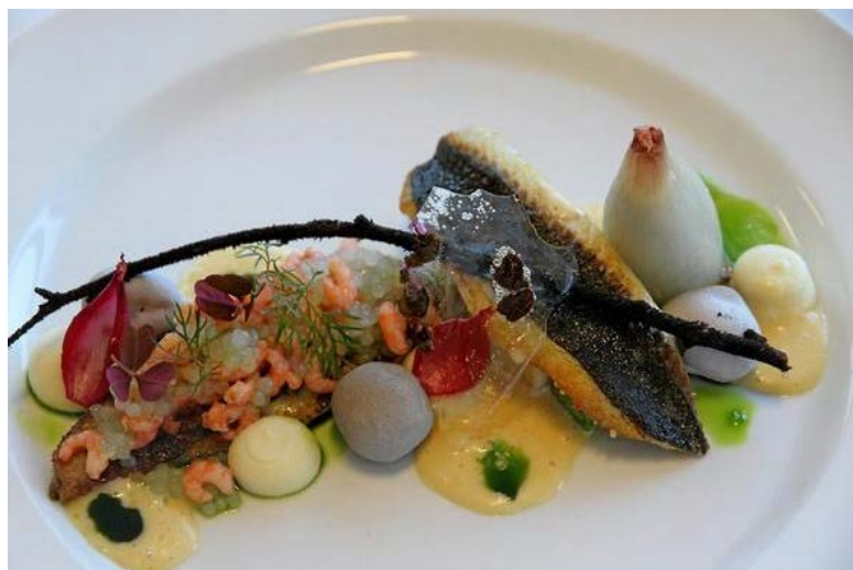
Restaurant SuRi i Holbæk vandt sidste år konkurrencen »Local Cooking« med denne ret, som hedder »Fjorden og Jorden«.