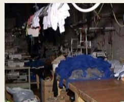
Polizei entdeckt unterirdische Stadt