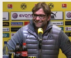
Klopp: "Bayern hat den Respekt verloren"