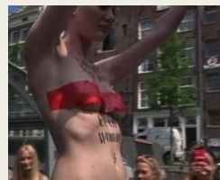
Modenschau im Femen-Style